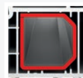
výztuha v rámu