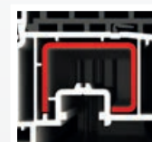
výztuha v křídle